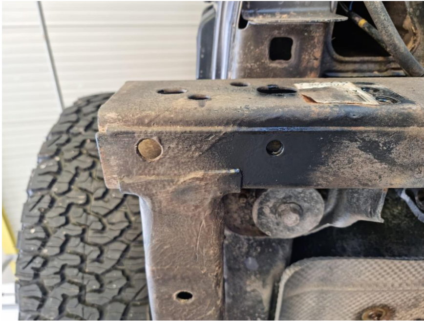
Auf dem Bild : 2012-2018

Löcher Anzeichnen und mit einem 13er Bohrer bohren und mit lack gegen Rost schützen.